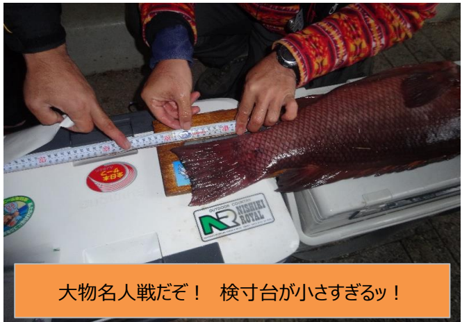
大物名人戦だぞ！ 検寸台が小さすぎるッ！